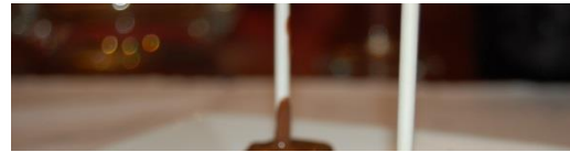
Lolly van Malibu en van Zoute Karamel